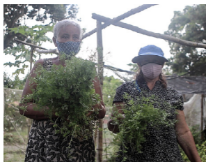
O cultivo de hortaliças está entre os aprendizados das mulheres camponesas.

Vamos plantar amor e não ódio! Um exemplo lindo de amor a terra vem da comunidade de Ilha de Mercês, em Ipojuca (PE), são as mulheres quilombolas que constroem a agroecologia.