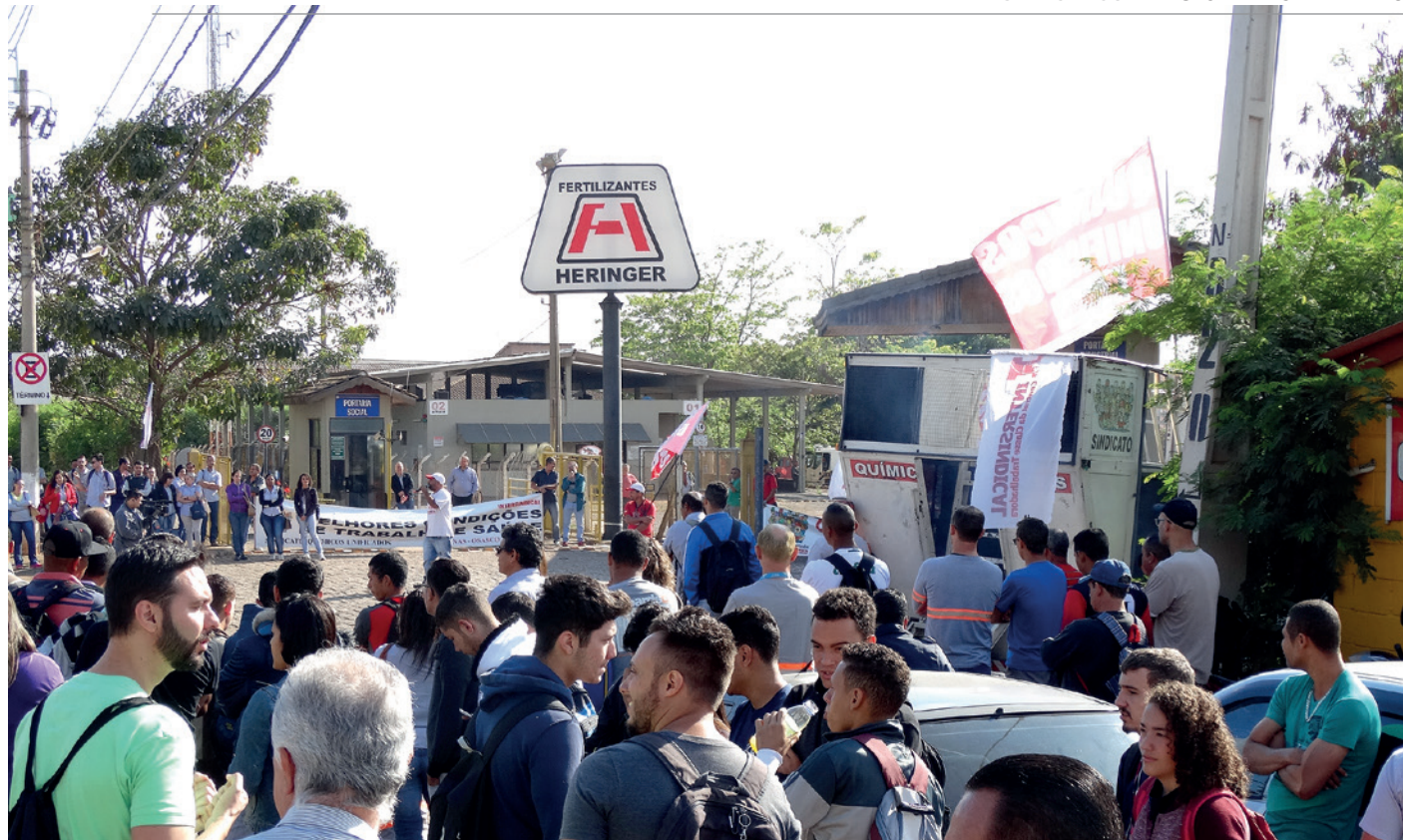
Trabalhadoras e trabalhadores em assembleia de campanha salarial 2016 na Heringer Fertilizantes, no bairro Betel, em Paulínia (em 07/10)