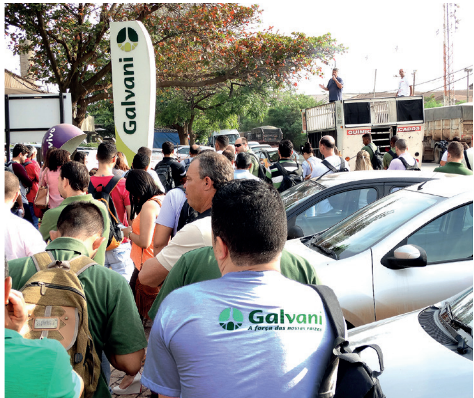
Na Galvani Fertilizantes, em Paulínia, atraso na produção (em 01/11)