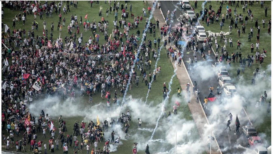
Feroz repressão, com bombas, tiros de balas de borracha, cassetetes e diversas prisões, a ato contra a PEC 241/55, em Brasília, no dia 29 de novembro. Foram 40 mil manifestantes

Com a PEC 241/55, a liberação indiscriminada da terceirização, a aposentadoria tornada praticamente inalcançável, ameaças contra a PLR e o arrocho salarial, entre outros, fica claro que para além de um golpe que rasgou a Constituição, jogou no lixo o voto de 54 milhões de brasileiros e colocou fim na democracia, ele foi contra a classe trabalhadora. Foi uma manobra entre capitalistas e políticos de direita para atacar e tirar direitos da classe trabalhadora, direitos estes conquistados nas lutas ao longo de muitos anos.