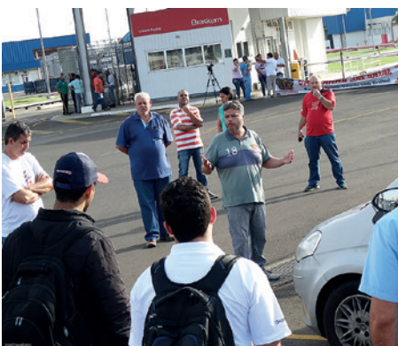
Mobilização na Braskem, Paulínia (em 17/11)