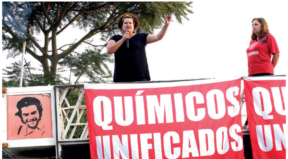
Assembleia na 3M do Brasil, em Sumaré (em 28/11)