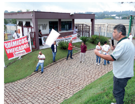
Assembleia na ITW, em Valinhos (em 18/11)

Quando não se chega a um acordo na campanha salarial, a divergência é levada à Justiça do Trabalho que, então, tomará uma decisão na questão. O ingresso desta divergência para ser analisada pela Justiça tem o nome de dissídio coletivo. Assim, esta campanha salarial já está na Justiça, com a instalação do dissídio coletivo. Nele, vamos defender que o reajuste seja integral e sem teto.