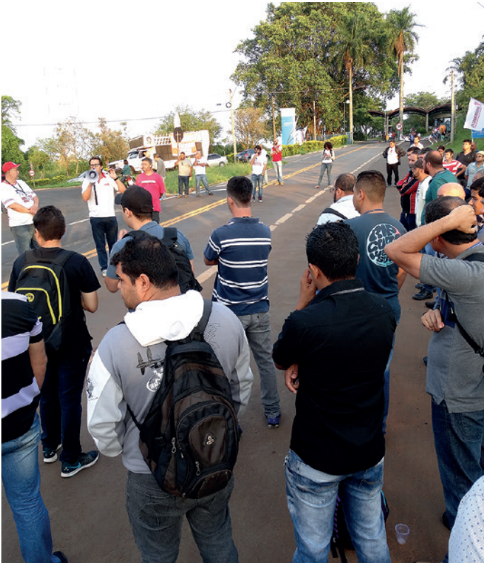
Assembleia com atraso da produção no chamado Condomínio Rhodia, em Paulínia (em 25/11)