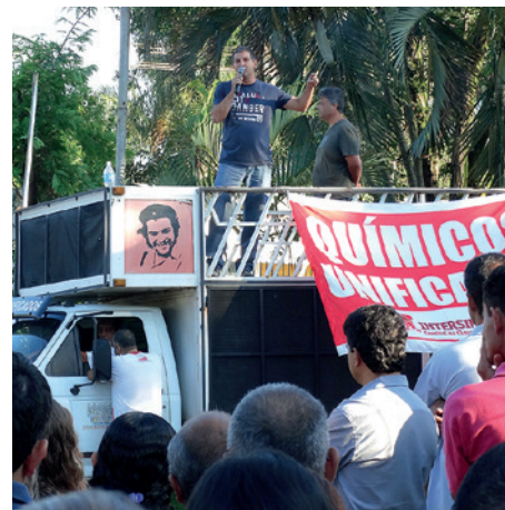
Assembleia na Invista, Paulínia (em 10/11)