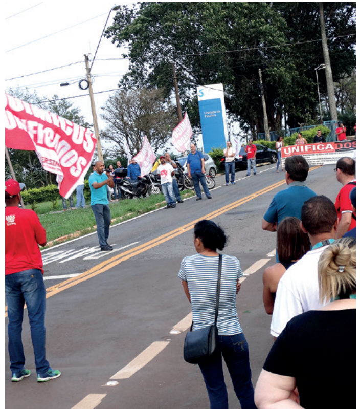
Assembleia e atraso no início da jornada no chamado Condomínio Rhodia, em Paulínia (em 20/10)