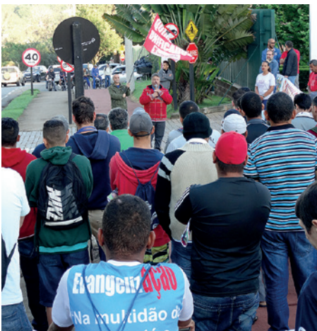
Assembleia na Hidroall do Brasil Ltda, localizada em Valinhos (em 28/10)