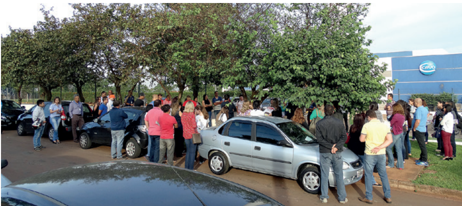
Assembleia na Ceva Veterinária, grupo francês, em Paulínia (em 02/12)