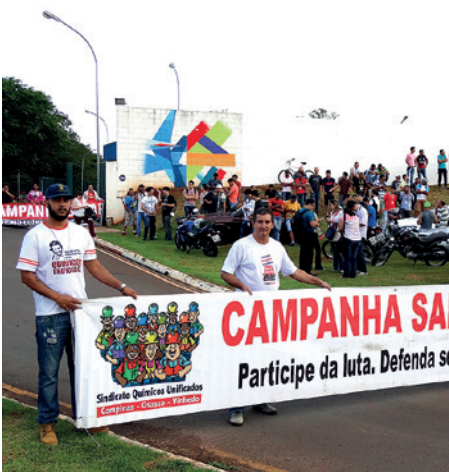
Assembleia na PPG. Sumaré (em 29/11)

MOBILIZADOS E UNIDOS, TRABALHADORES MOSTRAM DISPOSIÇÃO POR LUTAR NA CAMPANHA SALARIAL E NA DEFESA DE DIREITOS