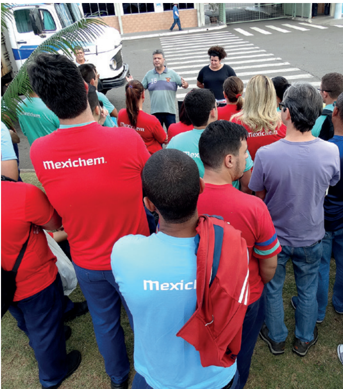
Assembleia na Mexichem (ex-Amanco), em Sumaré (em 05/10)