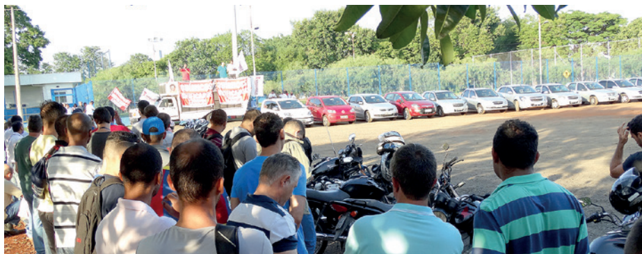
Assembleia na Sherwin-Williams, em Sumaré (em 07/12)