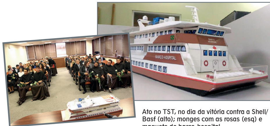
Ato no TST, no dia da vitória contra a Shell/Basf (alto); monges com as rosas (esq) e maquete do barco-hospital

O projeto está orçado em R$ 24,5 milhões e será gerido pela Fraternidade São Francisco de Assis. O cheque foi entregue à entidade pela Procuradoria Regional do Trabalho em Campinas (PRT-15), no dia 26 de outubro. Na cerimônia, frades e demais presentes depositaram 65 rosas brancas em homenagem aos