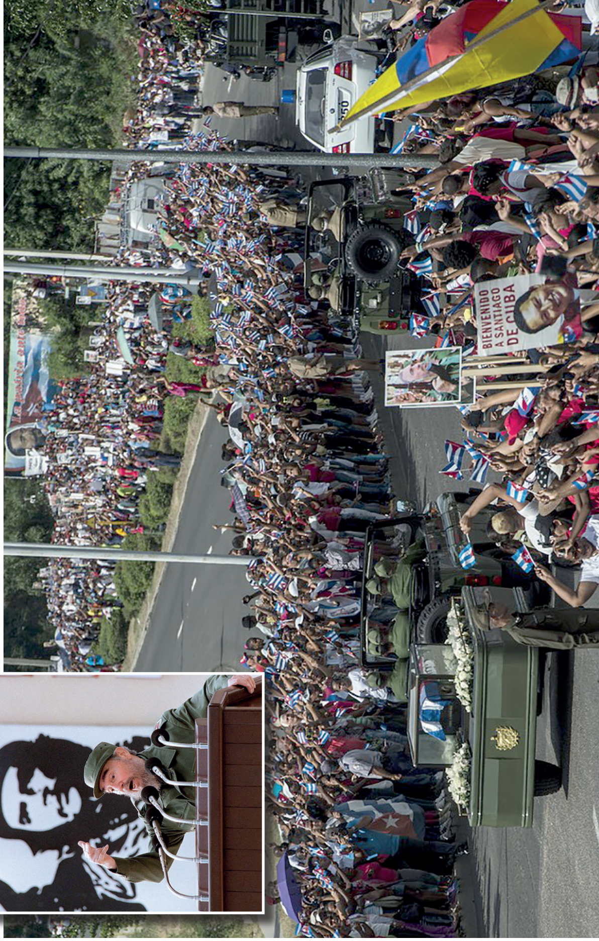
"HOJE, MILHÕES DE CRIANÇAS NO MUNDO DORMIRÃO NAS RUAS. E NENHUMA DELAS SERÁ CUBANA." – Frase de Fidel Alejandro Castro Ruz, ou simplesmente Fidel Castro, morto em 25 de novembro último, em Havana, capital de Cuba, aos 90 anos de idade. Ele liderou a histórica revolução que em 1º de janeiro de 1959 derrubou o violento ditador Fulgencio Batista, que transformara Cuba em "quintal dos Estados Unidos." Na foto, cubanos prestam homenagens na passagem das cinzas de Fidel Castro (no destaque).