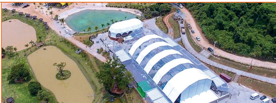
Foto aérea do espaço multiuso, para assembleias, encontros, debates, festas shows, danças etc, no Cefol da Regional Campinas

É a Regional Campinas do Unificados, sempre crescendo e cada vez mais oferecendo condições adequadas de lutas, festas, e atividades culturais de boa qualidade para associados(as) e seus familiares.