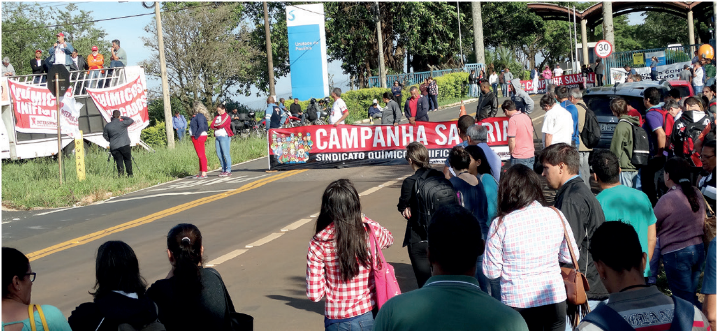
Segunda assembleia com atraso no início da produção em empresas no Condomínio Rhodia, em Paulínia. Após duas paralisações, Merial abriu negociações com a Regional Campinas e vai pagar os 100% (assembleia em 30/11)

REAJUSTE SALARIAL EM DUAS PARCELAS FOI RECUSADO PELOS TRABALHADORES. PARALISAÇÕES SE ALASTRAM NAS FÁBRICAS. SOB PRESSÃO, 104 EMPRESAS JÁ APLICARAM ACORDO PARA OS 100% A PARTIR DE 01 DE NOVEMBRO